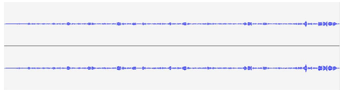
Je te veux (v.1) 1 2 3 silêncio